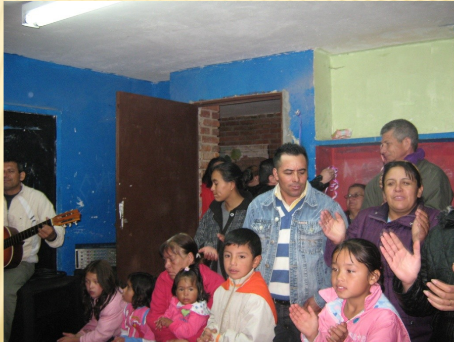
Mochuelo Ciudad Bolívar 2010

Todas aquellas actividades que se realizan a nivel local, en un espacio relativamente pequeño. Sin fines de lucro.