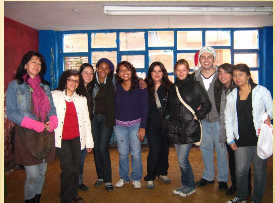
Mochuelo Ciudad Bolívar 2010