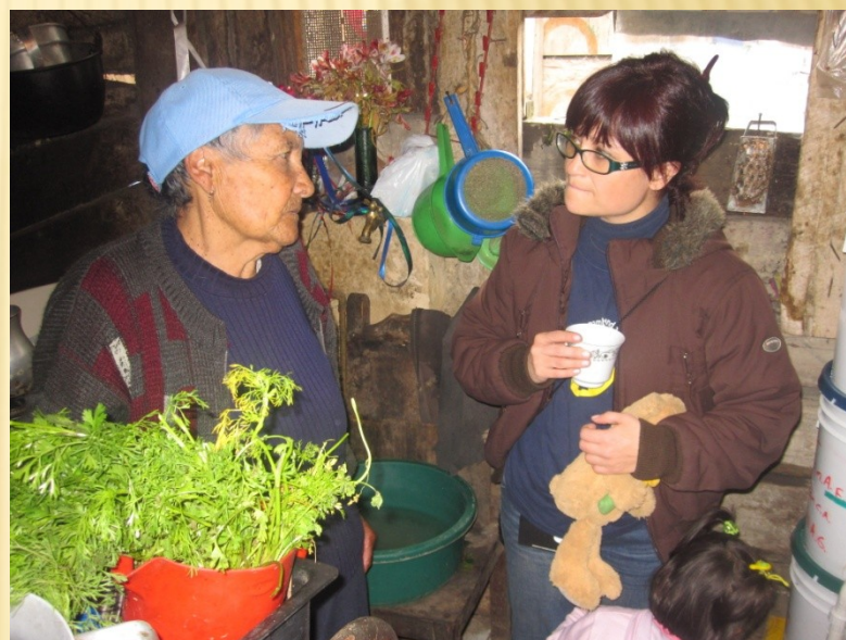
Mochuelo Ciudad Bolívar 2010