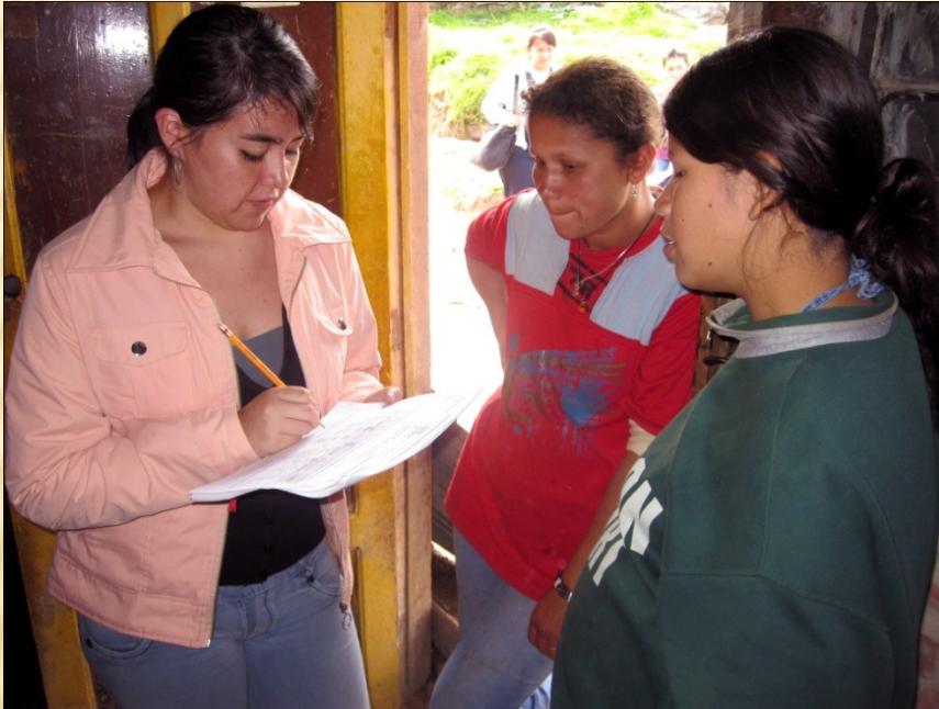
Mochuelo Ciudad Bolívar 2010