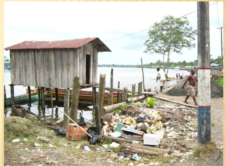
Guapi Cauca 2010