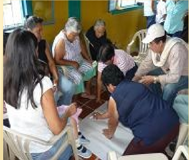
Guayabal de Siquima 2010