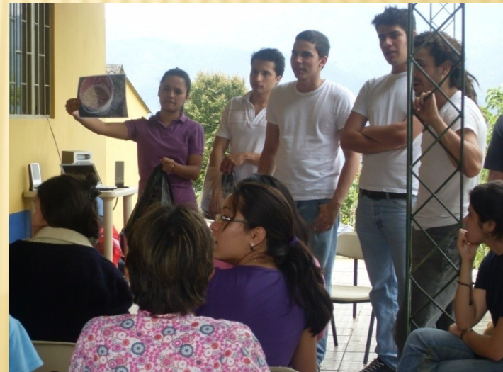
Guayabal de Síquima 2009