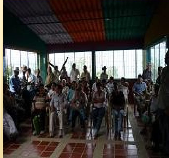
Guayabal de Siquima 2010