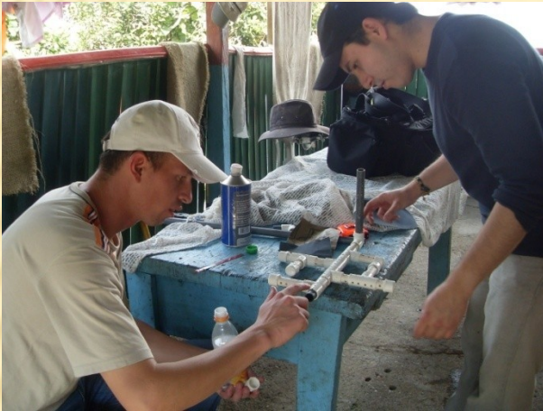
Guayabal de Síquima 2009