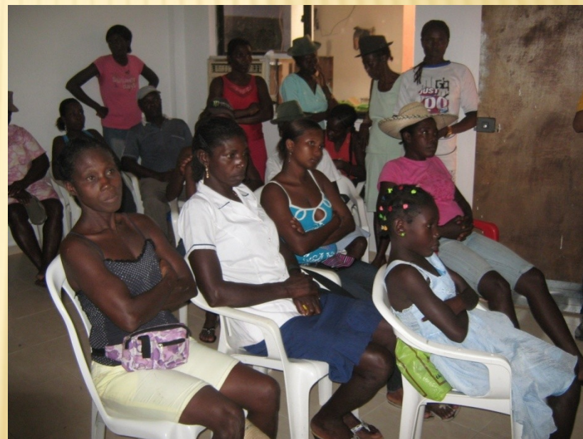
Guapi Cauca 2010