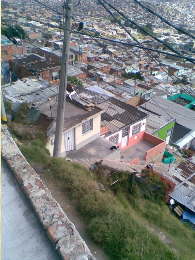
Ciudad Bolívar 2010