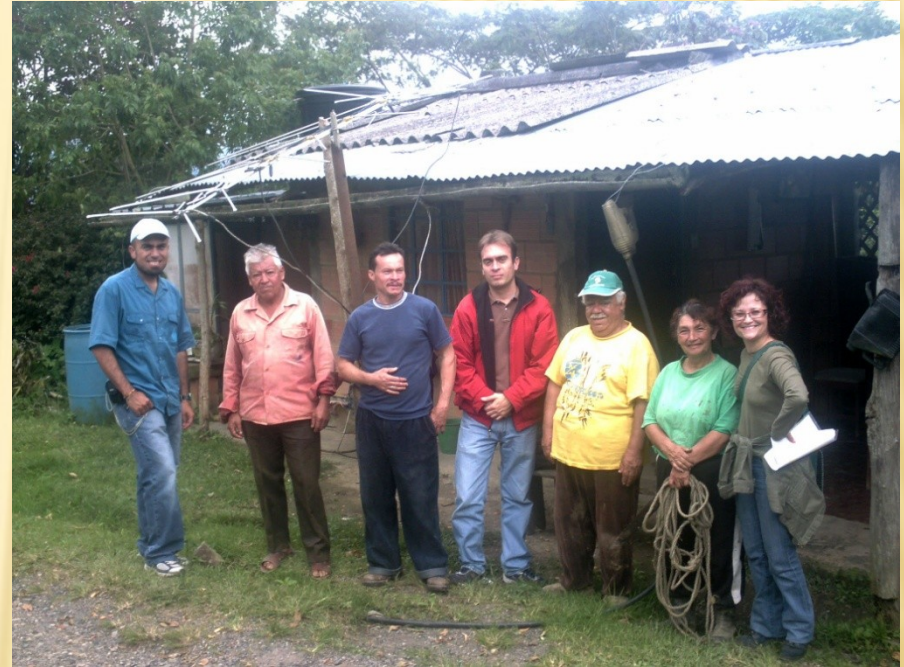
Guayabal de Siquima 2008

Crear un ambiente que permita a las personas disfrutar de una vida larga, saludable y llena de creatividad.