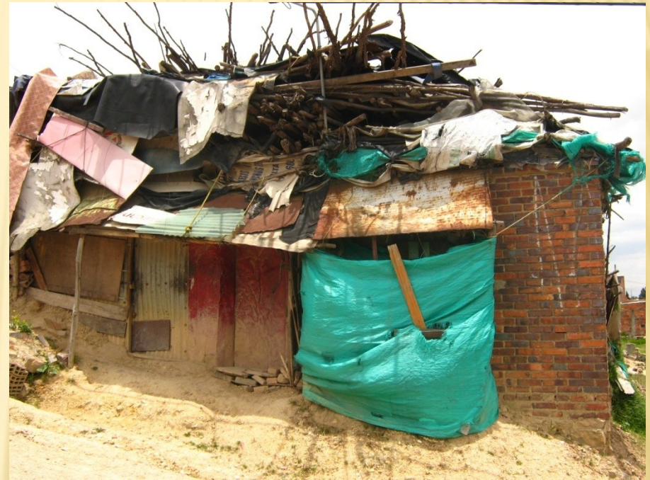
Mochuelo ciudad Bolívar 2011