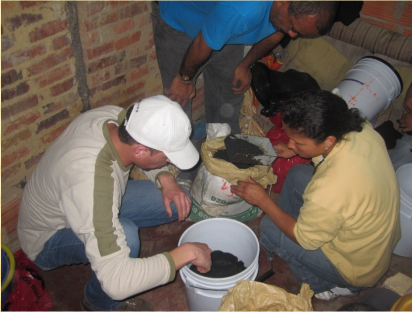
Mochuelo Ciudad Bolívar 2010