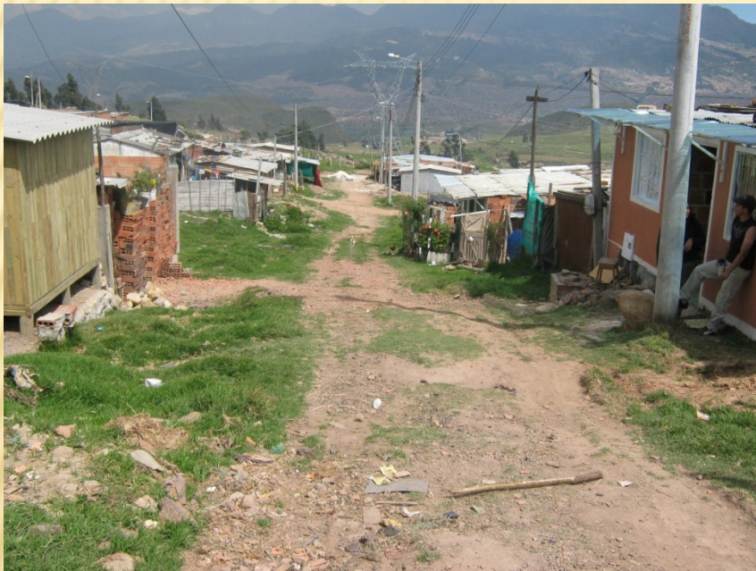
Mochuelo ciudad Bolívar 2010