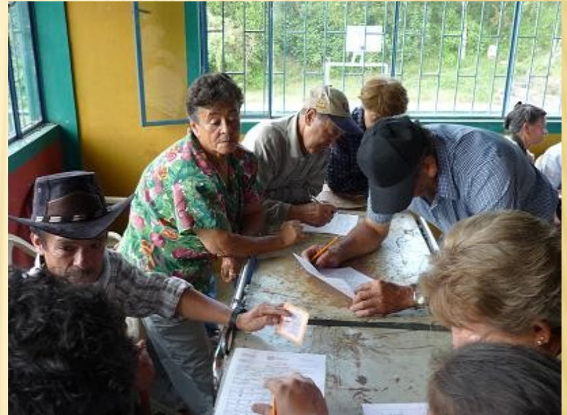
Guayabal de Siquima 2010