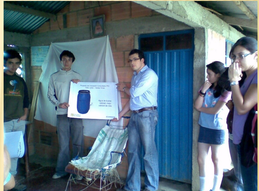
Guayabal de Siquima 2008