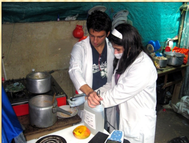
Mochuelo Ciudad Bolívar 2010