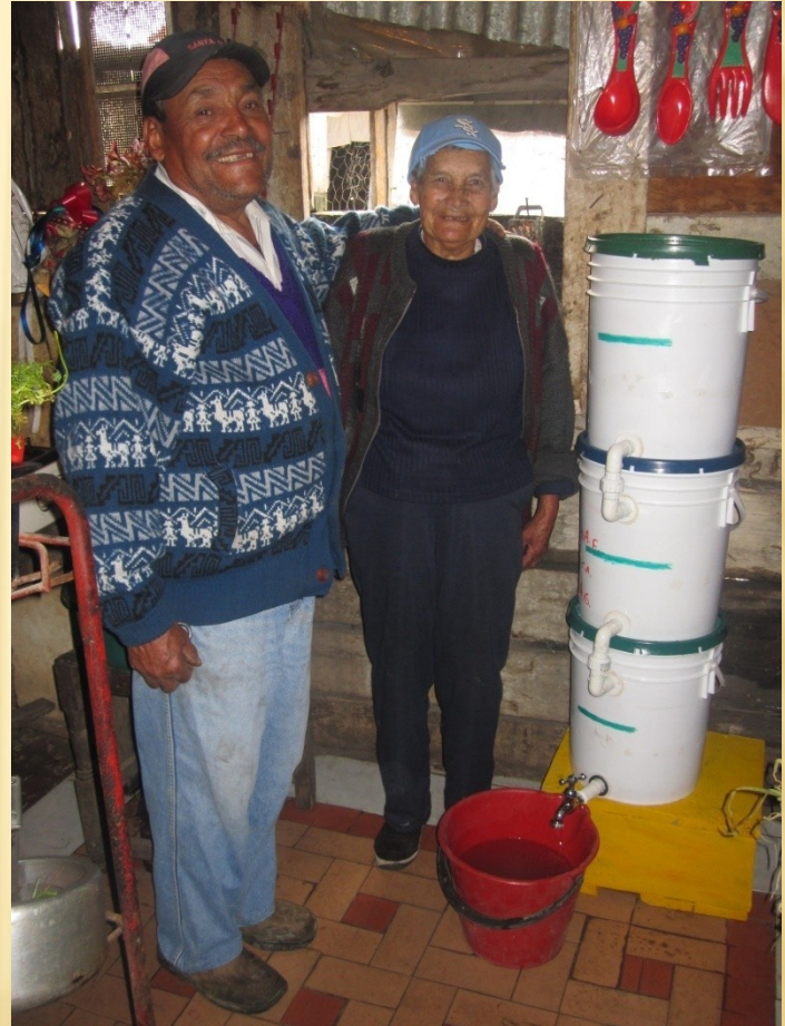
Mochuelo Ciudad Bolívar 2010