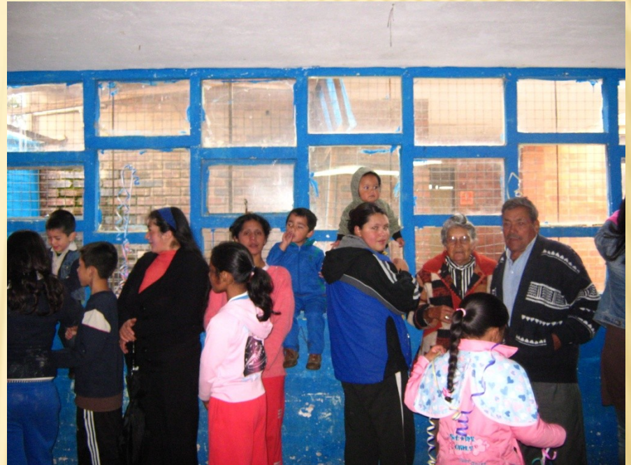
Mochuelo Ciudad Bolívar 2010