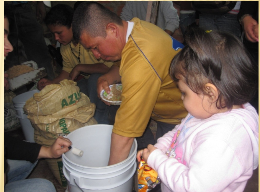
Mochuelo Ciudad Bolívar 2010