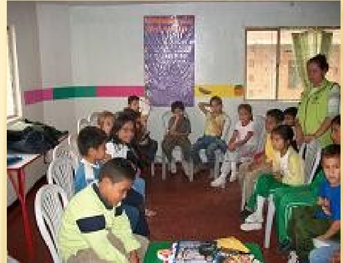
Ciudad Bolívar 2010