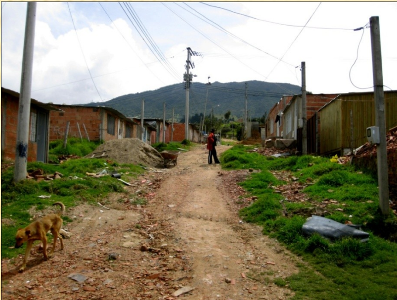
Mochuelo Ciudad Bolívar 2010