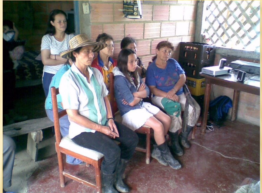
Guayabal de Siquima 2008