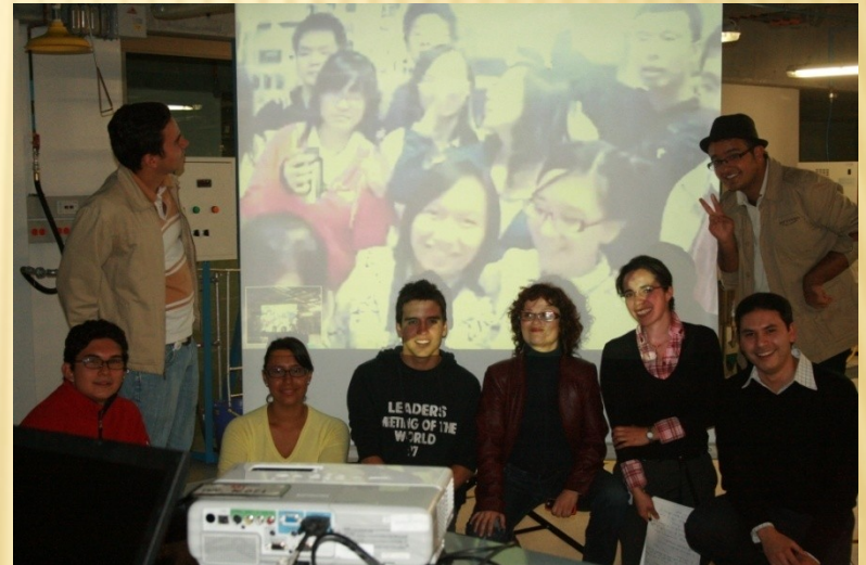
Universidad de los Andes 2009