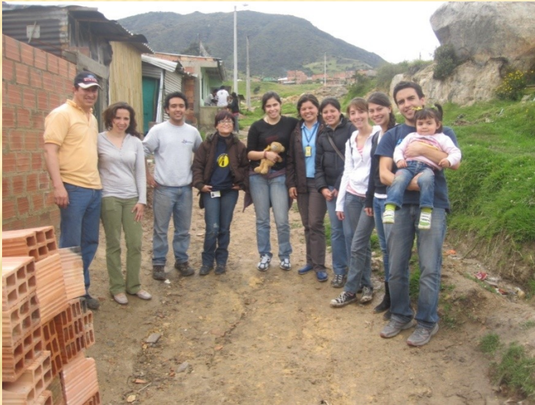
Mochuelo Ciudad Bolívar 2010